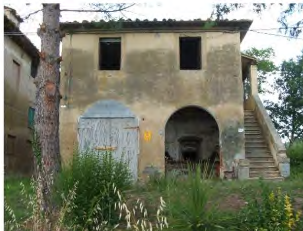
Edificio annesso con fondi occupati da stalle e forno e spazio abitativo al piano superiore con accesso da scala esterna.