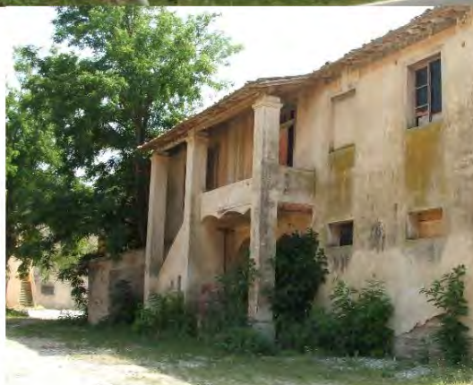
Prospetto est dell'edificio con l'accesso al piano superiore

Descrizione: casolare rurale a pianta rettangolare che si sviluppa su due livelli. Al piano terra sono esclusivamente vani di servizio come cantine, ciglieri e probabilmente stalle, a cui si accede da porte con rostra semicircolare ed altre con rostra rettangolare; sul retro, rispetto alla posizione della strada provinciale, è la scalinata esterna per l'accesso al piano residenziale del primo piano, con tettoia su pilastri a sezione quadrata. Le finestre del piano terra sono piccole e rettangolari, quelle al primo piano semplici, prive di riquadrature.