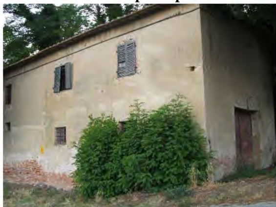
Edificio annesso al complesso rurale