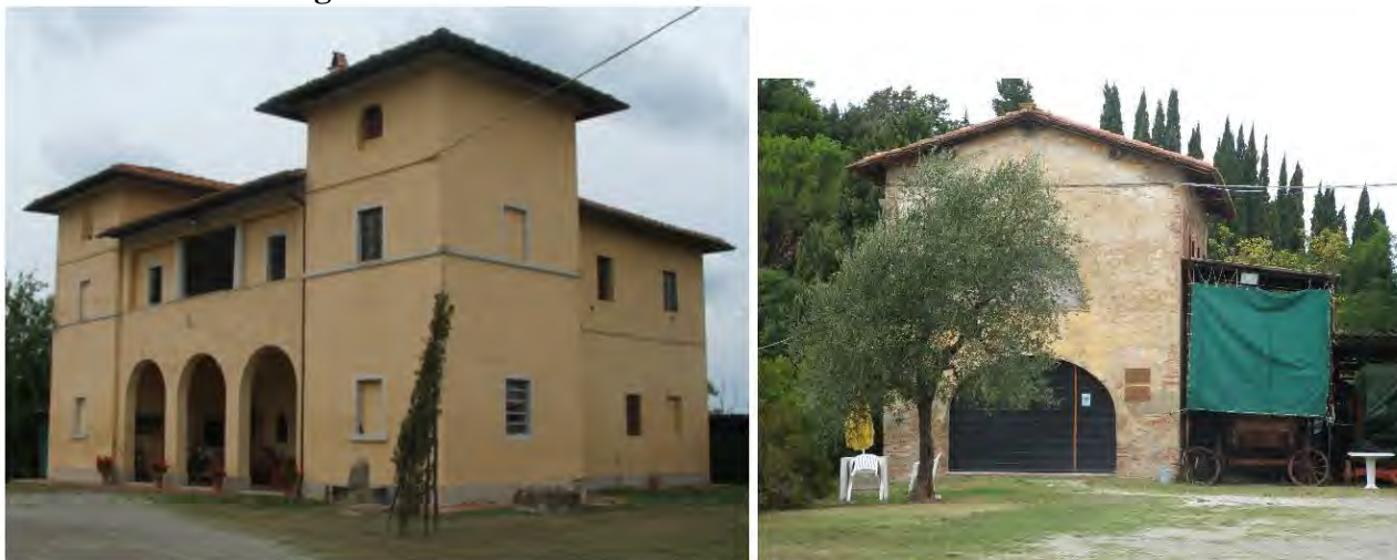
A destra il granaio utilizzato come fondo per la didattica del Museo

Descrizione: ampia villa padronale caratterizzata da due torrette appoggiate ai prospetti laterali. Al piano terra si aprivano gli accessi alle stalle e cantine, a di sotto di un ampio loggiato scandito da tre archeggiature a tutto sesto. Al primo piano del nucleo centrale dell'edificio in origine doveva aprirsi un loggiato su colonne, successivamente tamponato lasciando il tratto centrale aperto in funzione di terrazzo. Le torrette laterali possiedono un secondo piano con funzione abitativa, con unica finestra ad arco a tutto sesto.